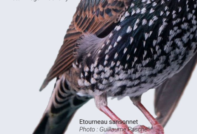
Etourneau sansonnet