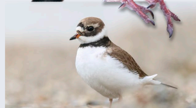
Pluvier grand-gravelot