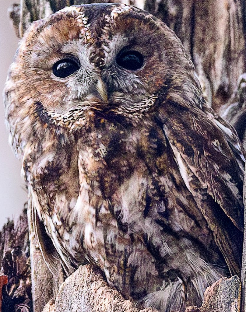
La Chouette hulotte