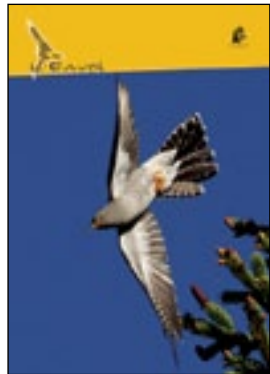
Couverture: Coucou gris Lionel Maumary (cf. brève ci-contre)

Comment participer à l'action de la Vaux-Lierre de manière simple ou originale ?